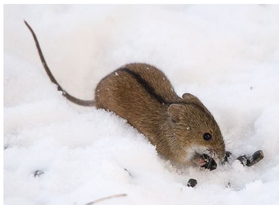
Apodemus uralensis cimrmani