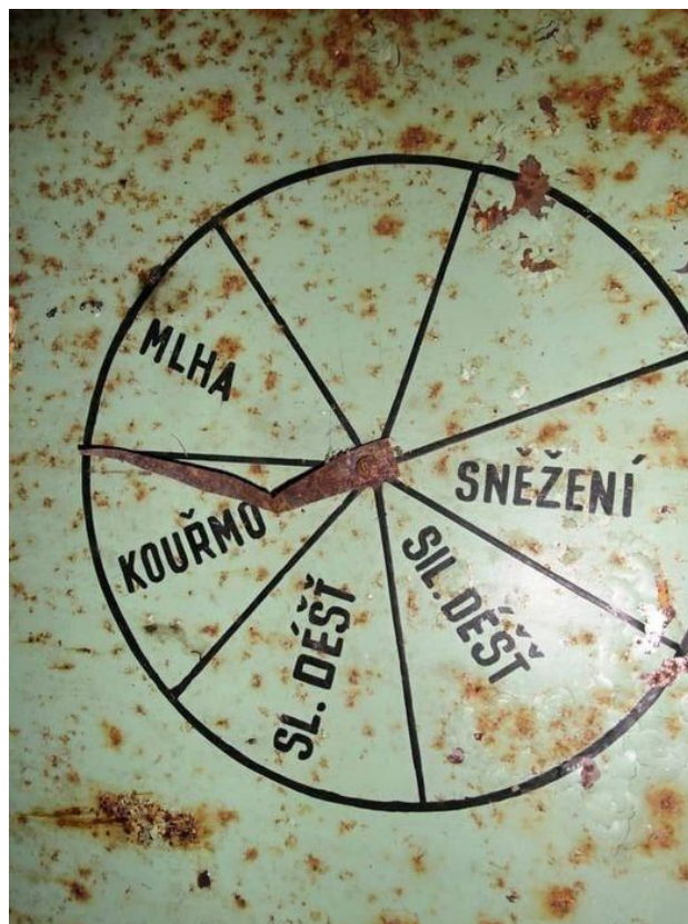
Cimrmanowy Zegar Pogodowy