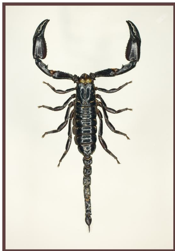
Skorpion Heterometrus Cimrmani