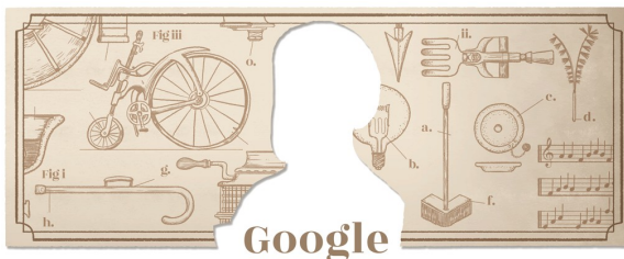
Google uczciło 50-lecie urodzin Járy 16.9.2016

Nie znamy wyglądu Járy Cimrmana, zniszczył wszystkie portrety, a nawet szkice. Dowiadujemy się o nim z listów, opowieści, dokumentów, oraz nielicznych artefaktów. Galeria „Ciasna” może poszczycić się niedawno zdobytym autoportretem Járy, co może świadczyć o tym, że Cimrman był przejazdem w Jastrzębiu, wtedy Bad Koenigsdorf, w drodze z Katowic w Izery.