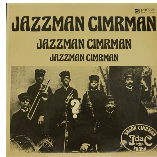
odtworzymy m. in. „Jazzuici” (chorał)

Sztuki Járy Cimrmana stale są wystawiane w Czechach – praskie „Divadlo Járy Cimrmana” ma w repertuarze kilkadziesiąt sztuk, z których każda poprzedzona jest prelekcją o osiągnięciach i życiu Autora. W roku 2014 nakęcony został film o poszukiwaniach jego polskich śladów „Czeski geniusz, aneb Jára Cimrman w Katowicach” – też go pokażemy!