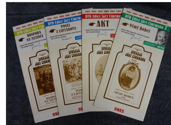
kilka DVD z praského teatru

Sztuki Járy Cimrmana stale są wystawiane w Czechach – praskie „Divadlo Járy Cimrmana” ma w repertuarze kilkadziesiąt sztuk, z których każda poprzedzona jest prelekcją o osiągnięciach i życiu Autora. W roku 2014 nakęcony został film o poszukiwaniach jego polskich śladów „Czeski geniusz, aneb Jára Cimrman w Katowicach” – też go pokażemy!